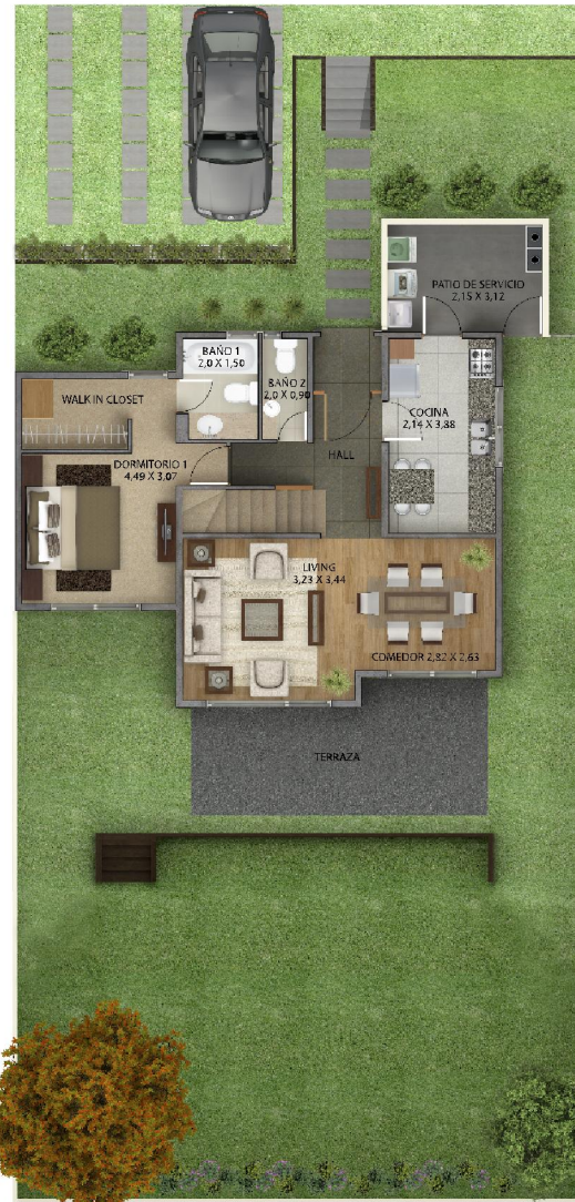
PLANTA PRIMER PISO PLANTA SEGUNDO PISO